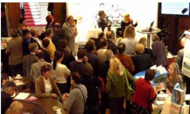
Meet the Expert