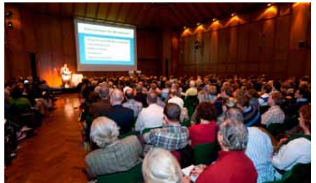
Plenarvorträge: 400 Personen im Saal Steiermark