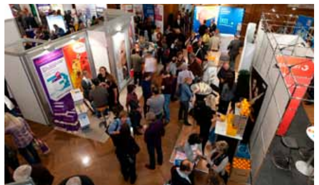
Die Ausstellung im Stefaniensaal