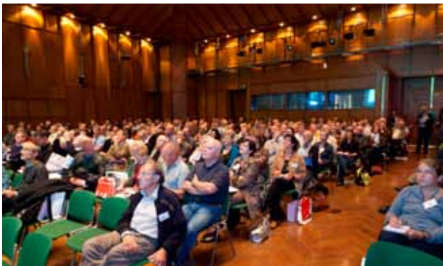
Saal Steiermark: Plenarvorträge