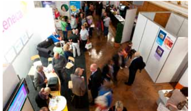
Stefaniensaal: Registratur und Ausstellung